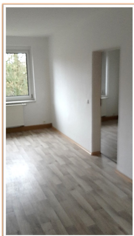
2. Kinderzimmer Bsp.